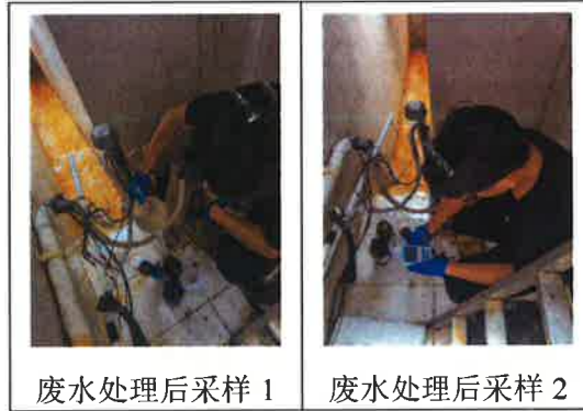
废水处理后的采样 1